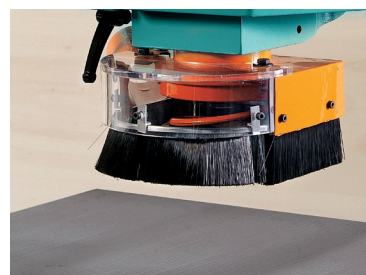
Option Basic Standard CE